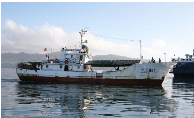
在斐济水域作业的中水公司渔业船舶

截至 2021 年 6 月，约 40 家中资企业在斐济开展经营活动，涉及渔业、旅游业、矿产资源开发、通信、工程承包、房地产、制造业等领域。主要投资项目有：浙江天洁集团水泥厂项目、山东中润资源投资斐济瓦图科拉金矿公司等项目。