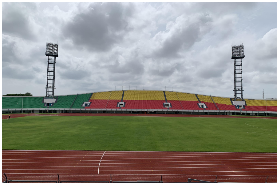
中国政府援建的贝宁马蒂尔·克雷库将军友谊体育场及维修项目

中国公司于1985年进入贝宁工程承包市场。中方公司实施的承包工程项目以优质取得贝方的信任，在贝宁赢得较好声誉。据中国商务部统计，2020年中资企业在贝宁新签承包工程合同额3.87亿美元，同比增长2683.0%，完成营业额2.34亿美元，同比下降4.0%。新签大型承包工程项目主要有中国建筑中标的贝宁新议会大厦项目、中国港湾的科托努港改扩建工程、中水电的贝宁棉花之路项目、湖南路桥的科托努市雨水整治项目一期等。据中国驻贝宁使馆经商处统计，截至2021年5月底，在贝宁的中国籍劳务人员共951人。目前，驻贝宁中资企业约有30家，主要分布在工程承包、通信建设、制糖、纺织、农产品加工等领域。