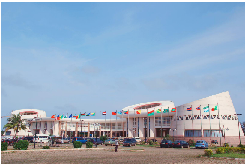
中国政府援建的贝宁科托努会议大厦